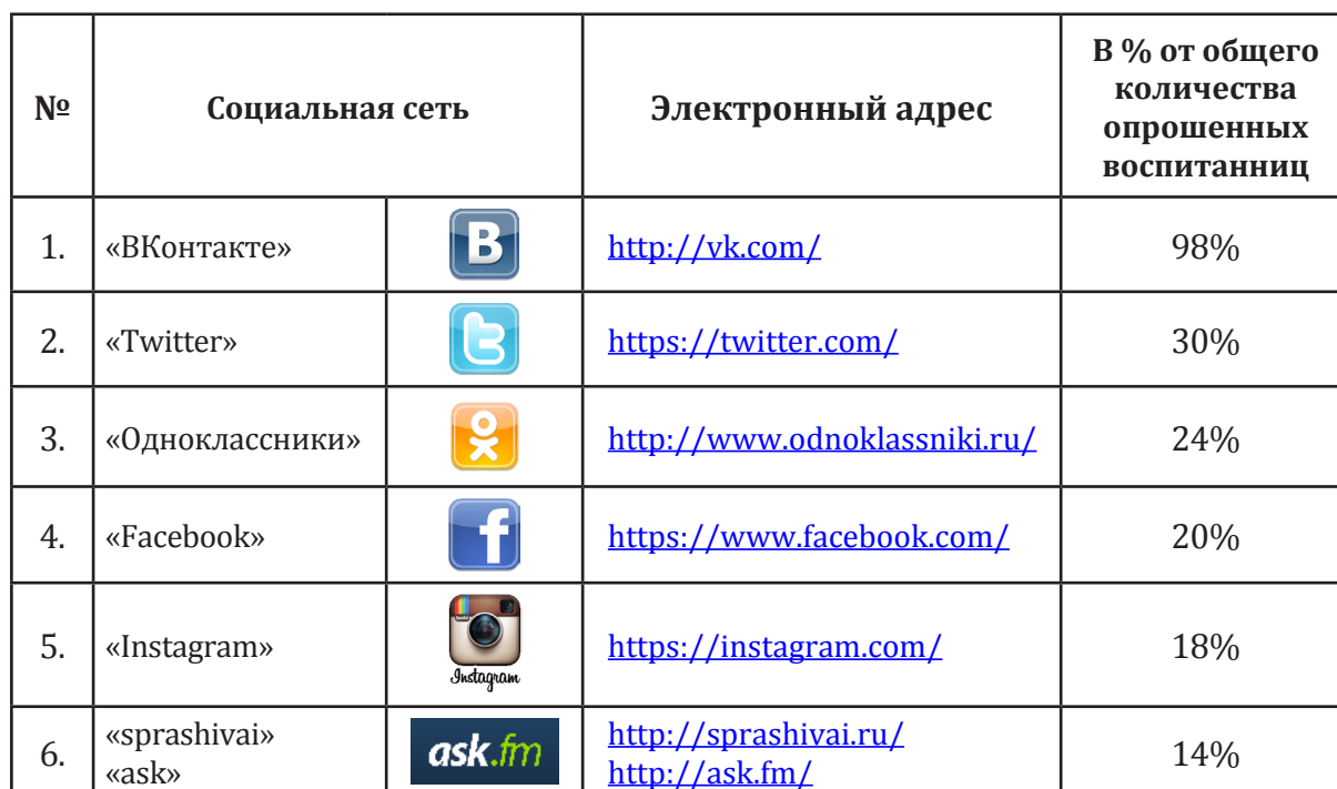
Таблица 1. Рейтинг социальных сетей

Воспитанницы выделили основные направления использования социальной сети: